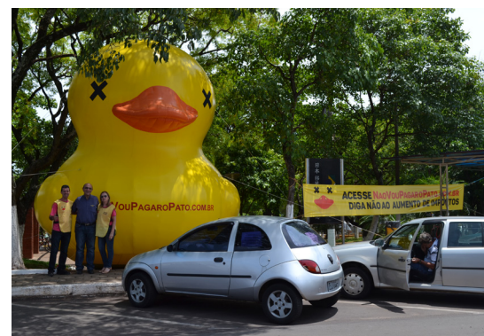
Pato representa a causa contra o aumento dos impostos