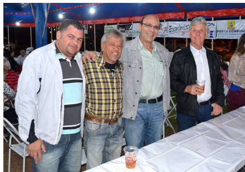
Dentre as contribuições sociais realizadas pela ACE, a Quermesse dos Amigos foi uma delas, muito especial

Fale conosco, conheça nossos serviços e envie sugestões.