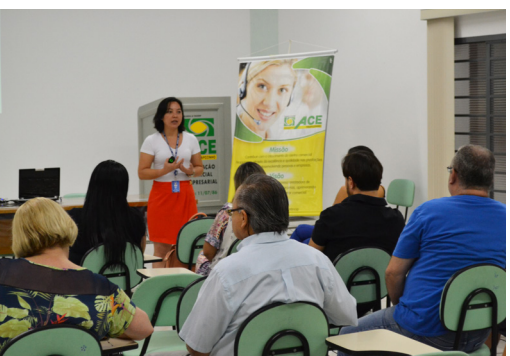
Palestra "Tributação na medida" realizada pelo Sebrae, no auditório da ACE