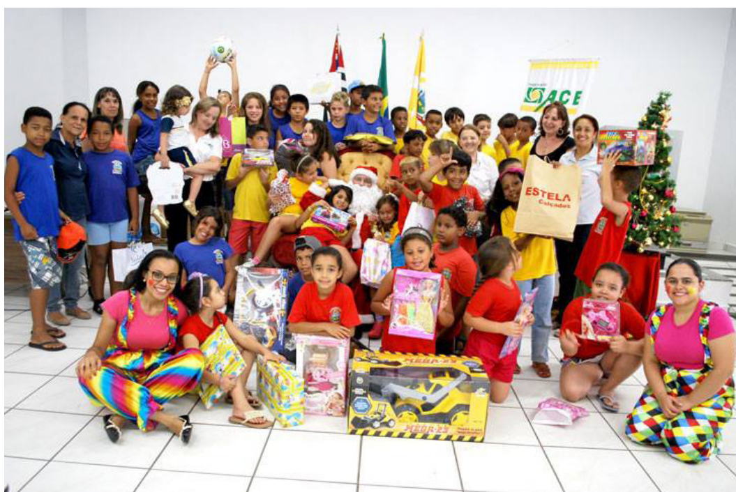
Campanha tem o objetivo de interagir crianças de escolas particulares com beneficiadas de projetos sociais

Desde 2009, uma iniciativa da Associação Comercial e Empresarial de Pirapozinho, em parceria com o Fundo Social de Solidariedade, contribui para que o Natal de mais de 300 crianças da cidade seja ainda mais feliz. Trata-se da campanha intitulada Árvore da Solidariedade, que pela sétima vez já tem data marcada.