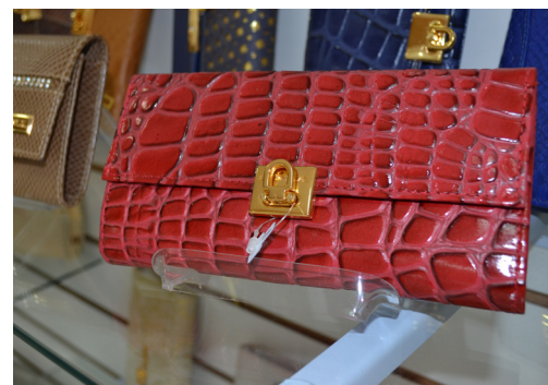
Baccaro aposta em produtos de qualidade para fidelizar clientes

Ter bom atendimento, respeito, humildade, bom preço, garantia de produtos de qualidade e de estar sempre atualizada com a moda e principalmente o pós-venda, ouvir seu cliente, pois ele sempre tem razão.