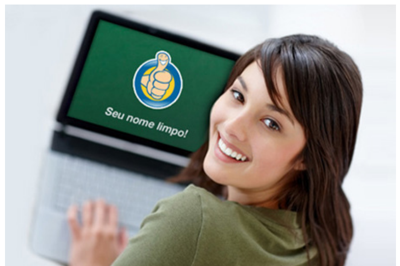
Campanha será realizada no início de dezembro

Realizada pela Boa Vista SCPC desde 2010, a “Acertando Suas Contas” já beneficiou diversos clientes e consumidores e gerou ótimos resultados: 815 mil famílias atendidas, 346 mil renegociações de dívidas, mais de 700 empresas já participaram, a campanha já foi realizada em 52 cidades em diferentes localidades no Brasil.