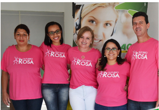
O mês de outubro marca a luta contra o câncer de mama. Os colaboradores da associação já "vestiram a camisa"