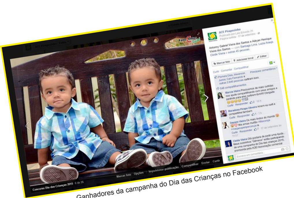
Ganhadores da campanha do Dia das Crianças no Facebook

Em Pirapozinho, a campanha do Dia das Crianças foi realizada pela Associação Comercial e Empresarial (ACE), de primeiro à 10 de outubro, data em que o horário foi estendido até às 17h.