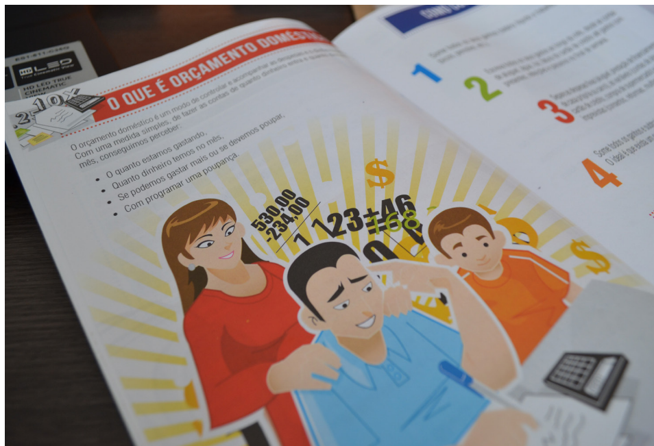
Cartilha explicativa orienta consumidores

Em parceria com a Boa Vista Serviços, que administra o Serviço Central de Proteção ao Crédito (SCPC), a Associação Comercial e Empresarial de Pirapozinho realizará em dezembro a campanha Acertando Suas Contas, que ocorrerá entre os dias 01 e 05 de dezembro. Segundo a organização da campanha, a iniciativa dá a oportunidade ao consumidor de renegociar suas dívidas diretamente com o seu credor, e com condições especiais. “Além disso, dará todo o suporte de educação financeira ao consumidor, para que ele se habitue ao planejamento e utilize o crédito a seu favor”.