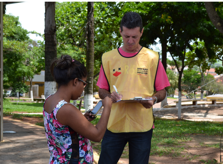
Cidadãos assinaram o manifesto na sexta e sábado