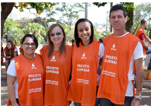
Equipe ACE marcou presença no evento Iluminar - Multirão de entrega de lixo eletrônico, promovido pela Sina, na Praça Manoel Marques Silva

Muitos eventos marcaram os últimos meses da Associação Comercial e Empresarial de Pirapozinho. Um deles, o Projeto Iluminar, teve apoio da entidade, com o carro de som e a equipe marcou presença do dia do evento. Confira estes e outros acontecimentos importantes.