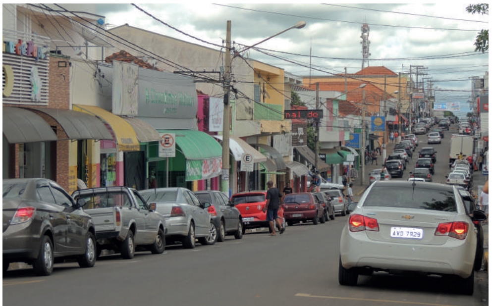
Frota de carros na cidade ultrapassa os 14 mil

Atualmente, a fiscalização feita pela PM (Polícia Militar) no município contempla apenas a documentação do veículo e do condutor. O comandante da 3ª Companhia de Pirapozinho, Capitão PM