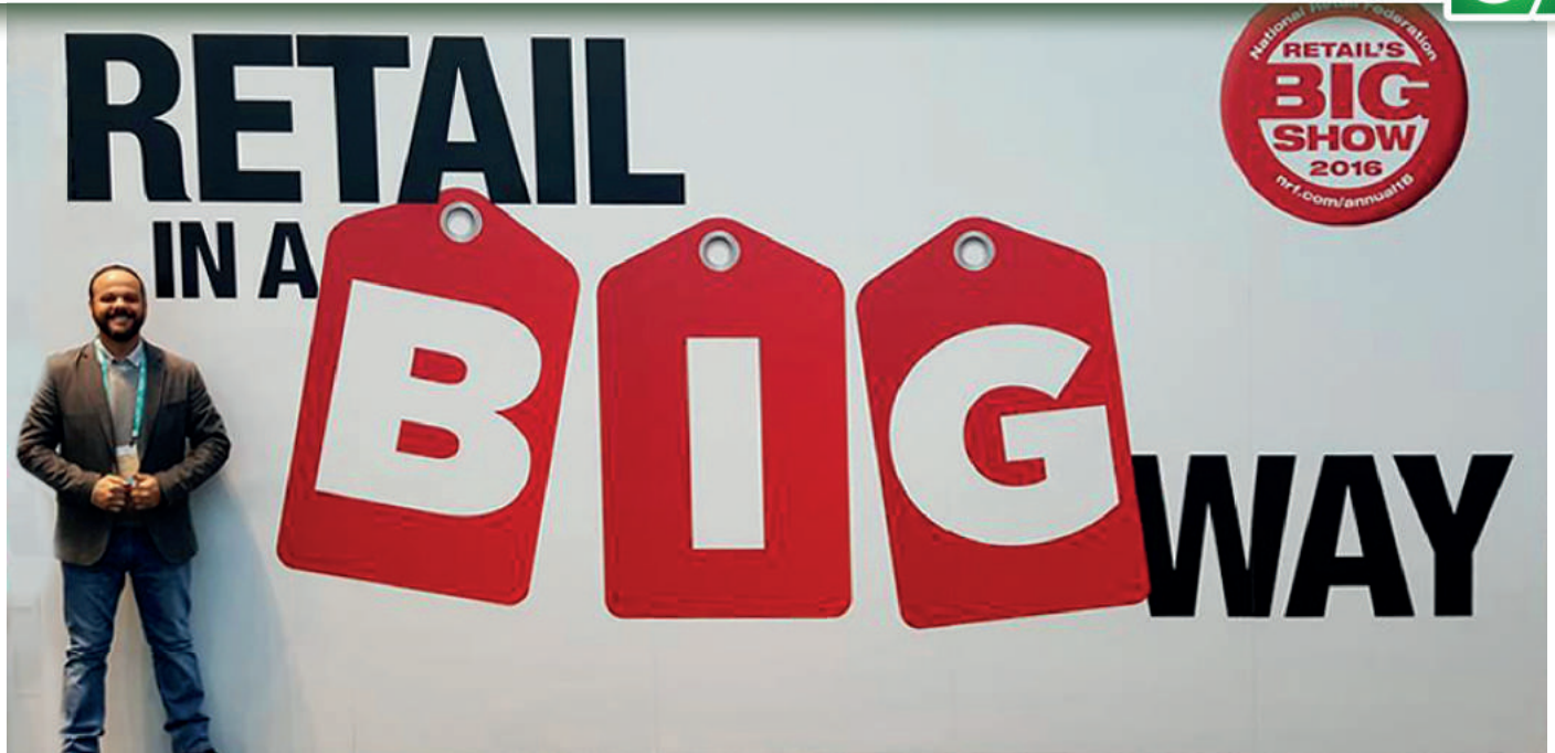
Julio Cesar de Moraes, empresário associado, na 105ª edição do "Retail's Big Show"