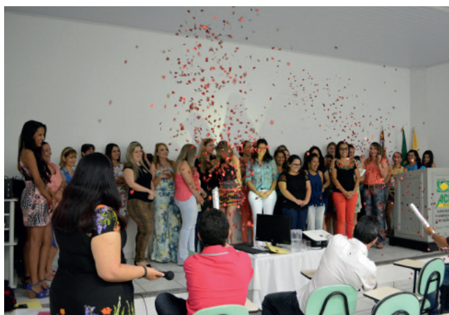
Mulheres foram homenageadas pelo Dia Internacional da Mulher