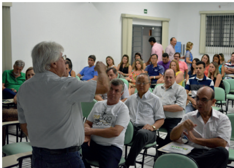
Empresários se reuniram para conhecer as campanhas 2015

O encontro foi também uma oportunidade para homenagear as mulheres, em especial as empreendedoras do comércio de Pirapozinho e região. O evento homenageou aquelas que assumiram seu lugar na sociedade, sem perder a doçura e a feminilidade, pelo Dia Internacional da Mulher.