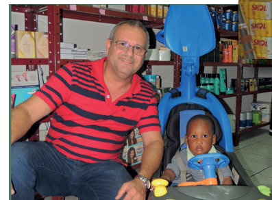
Luiz Eduardo Vieira Priscelles Perfumaria