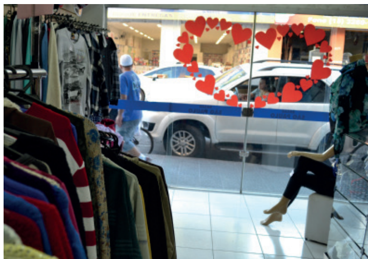
Lojas investem na decoração para atrair consumidores

Um dos principais atrativos desta campanha promocional são os prêmios. A compra em qualquer uma das empresas participantes garante cupom para concorrer a dias de lazer (Day Use), para 18 casais, no Terra Parque Eco Resort de Pirapozinho; além de mais dois no concurso realizado nas redes sociais.