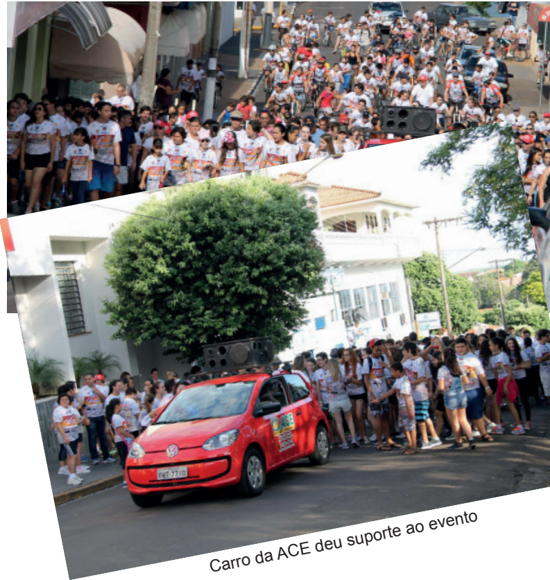
Carro da ACE deu suporte ao evento