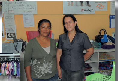
Aparecida da Silva Rainha Confecções